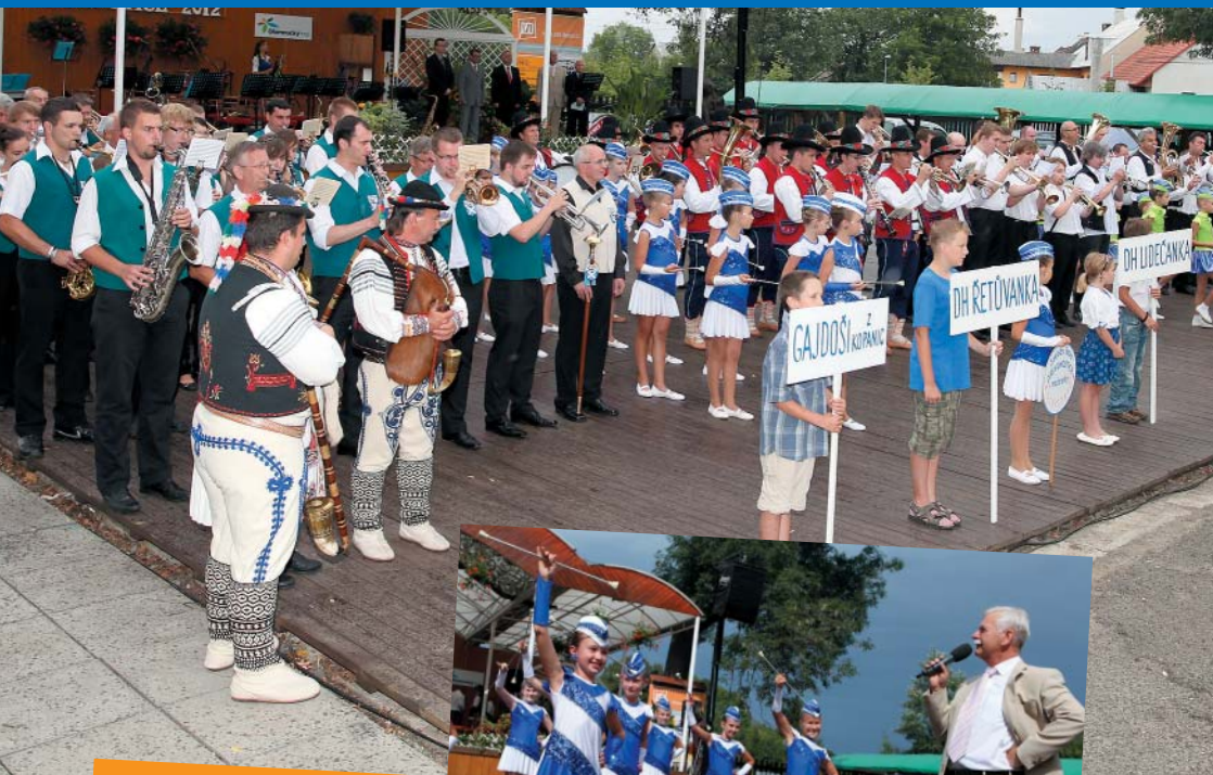
Setkání dechových hudeb 2012