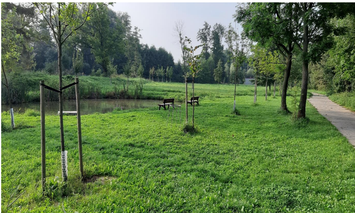
Obr. č. 17 – plocha pro workoutové hřiště Za koupelkou a prostor pro rybářský sport