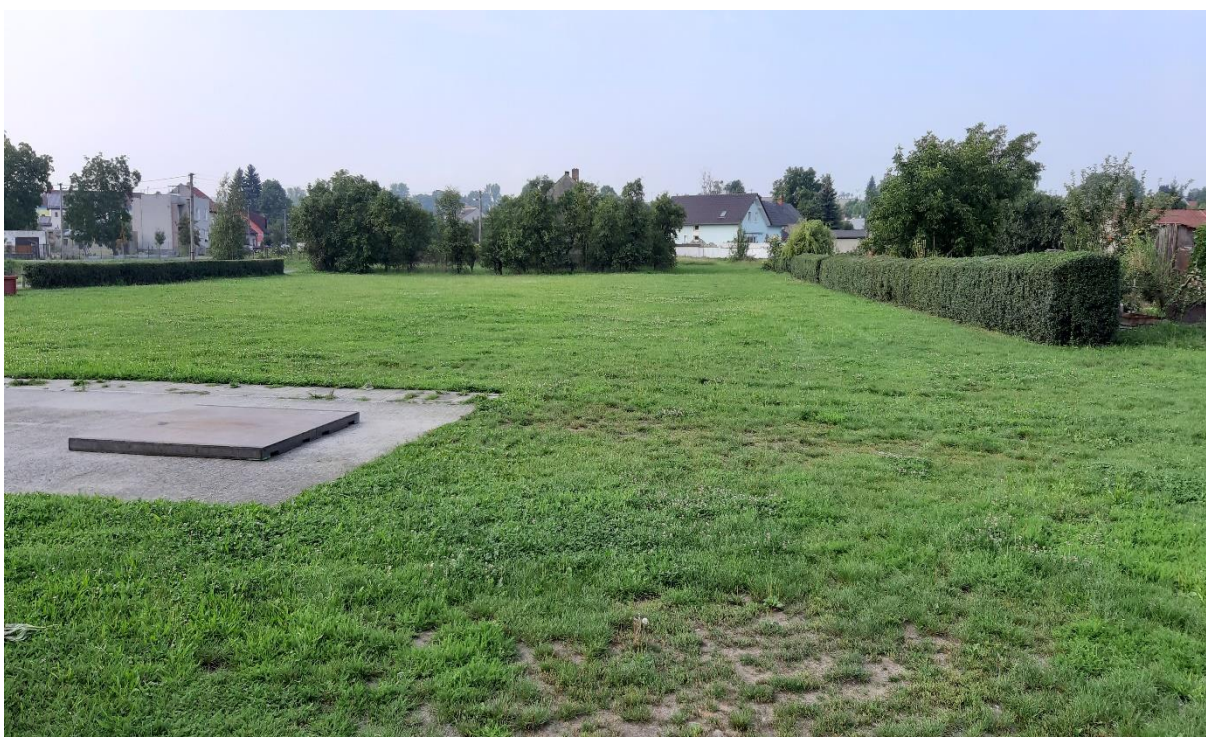
Obr. č. 16 – sportovní areál pro hasičský sport