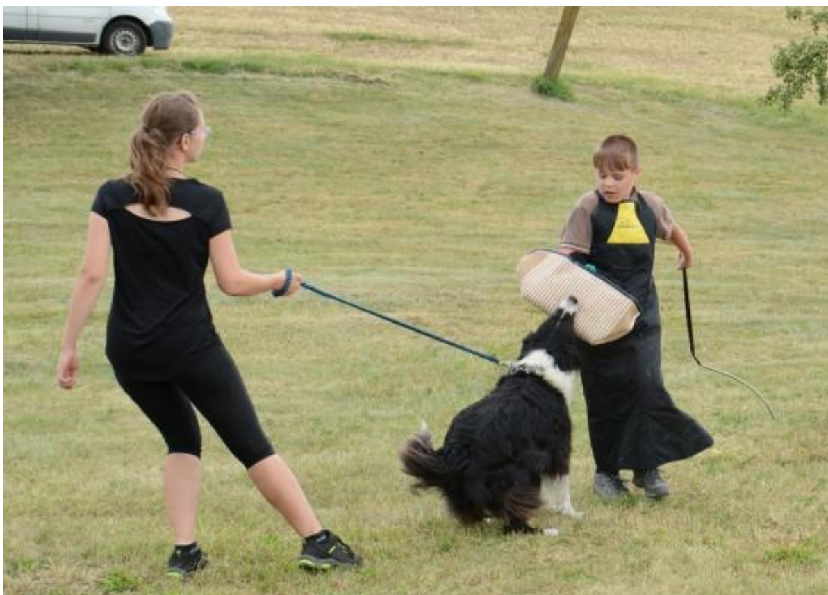
Obr. č. 3 – Kynologický klub Dřevhostice