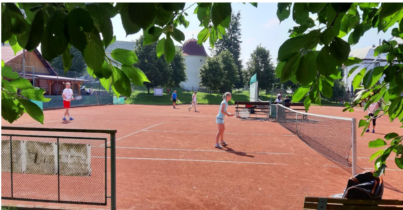
Obr. č. 8 – Tenisové kurty za sokolovnou