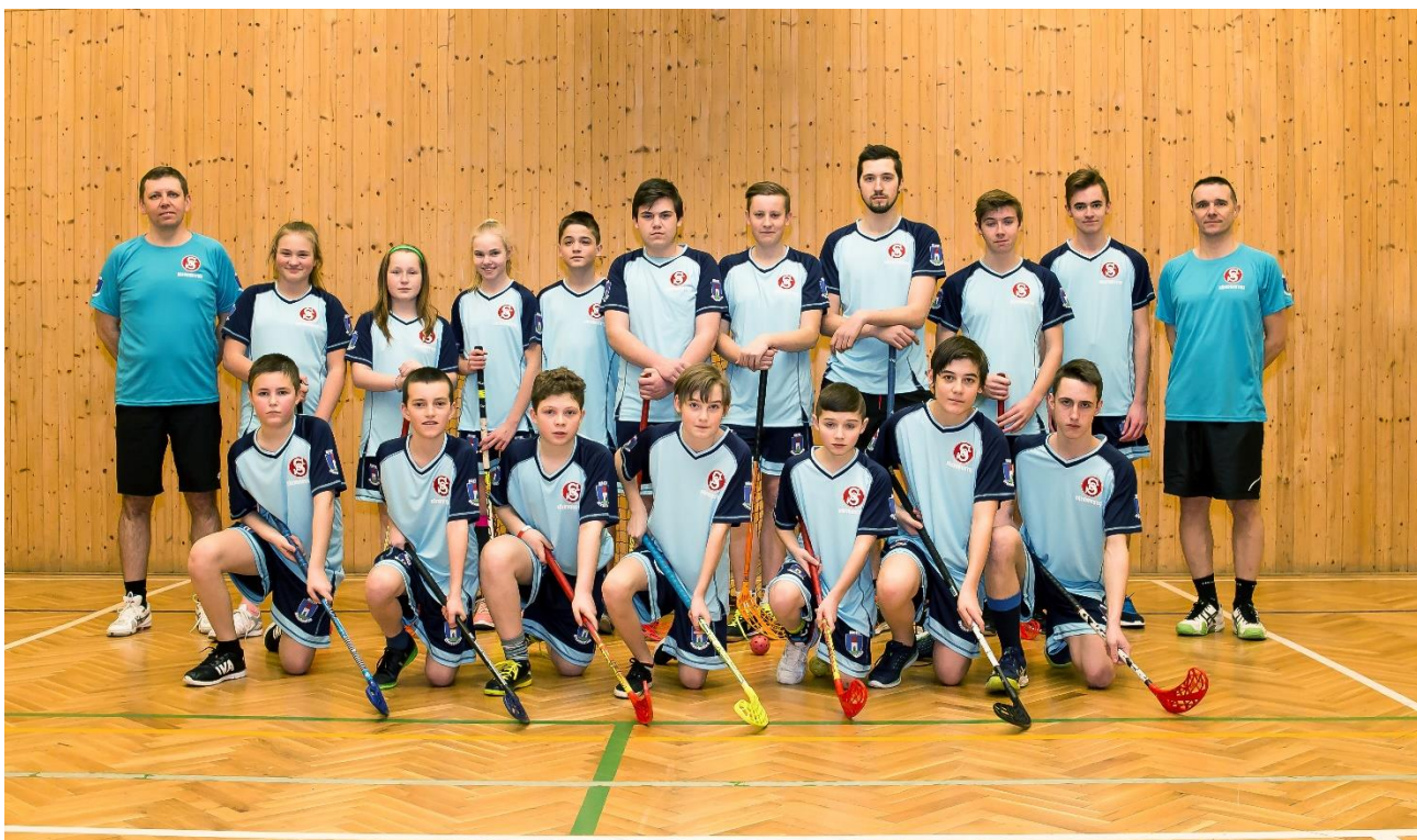
Obr. č. 5 – T.J. Sokol Dřevohostice florbalový oddíl