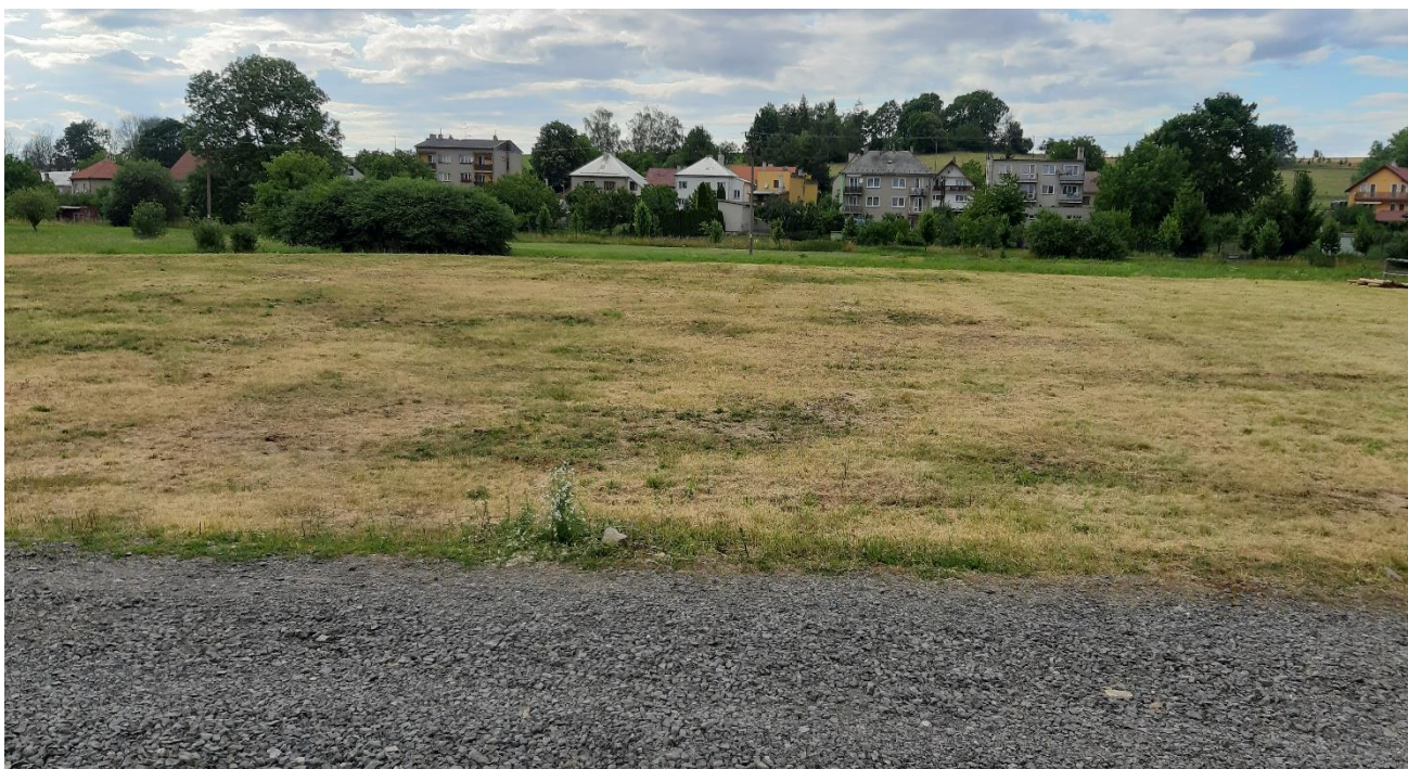
Obr. č. 9 – Travnaté hřiště za sokolovnou