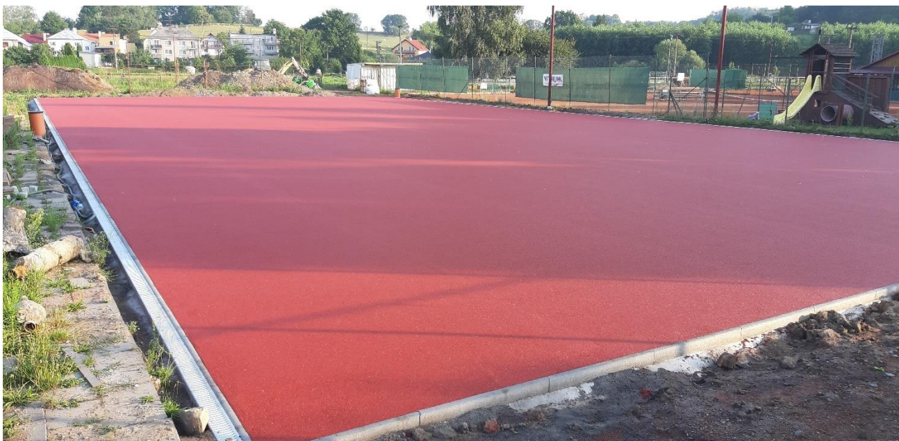
Obr. č. 7 – Multifunkční hřiště za sokolovnou