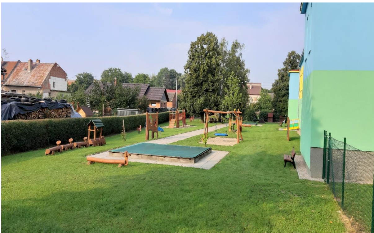
Obr. č. 13 – dětské hřiště u MŠ