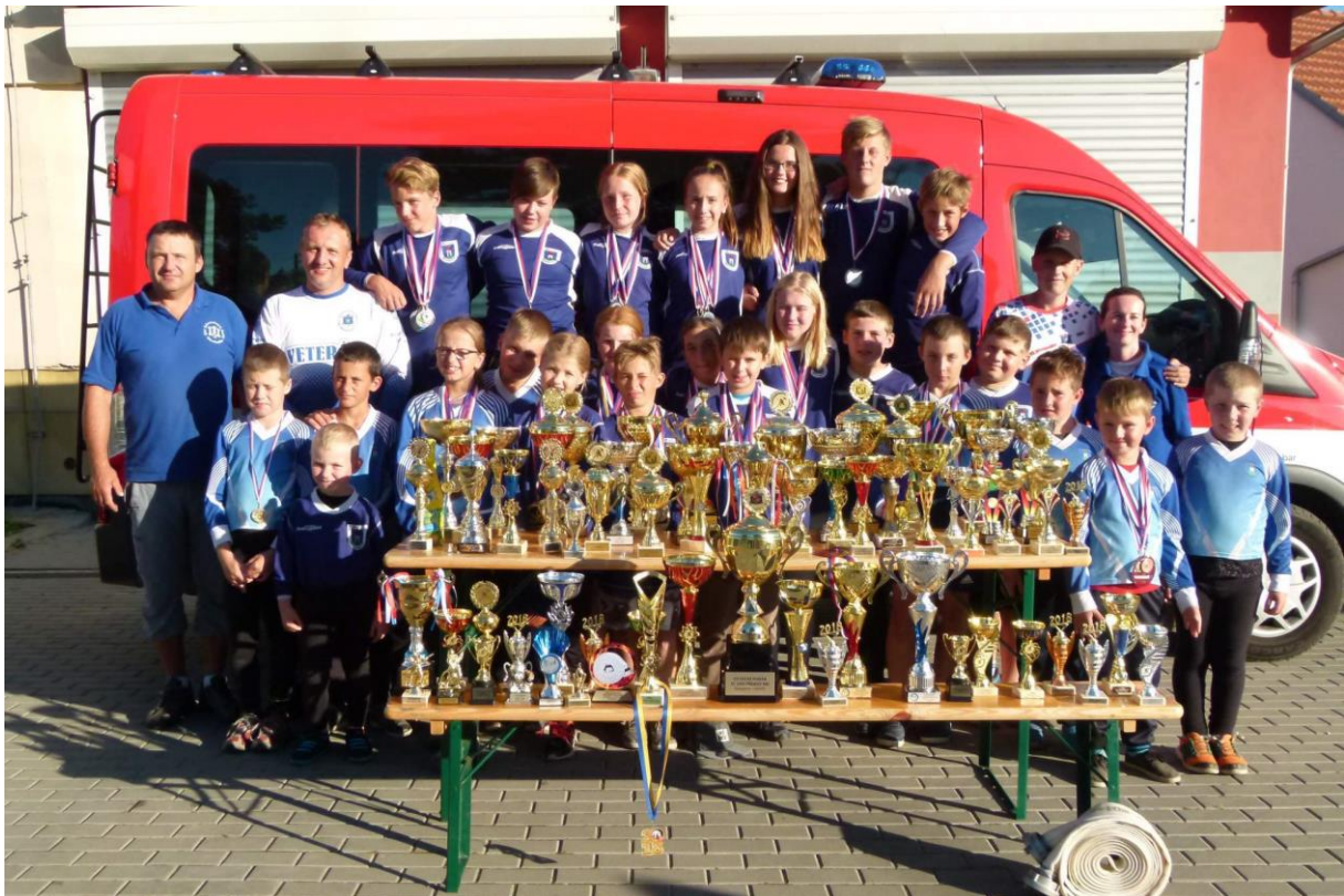
Obr. č. 1 – členové SDH Dřevohostice