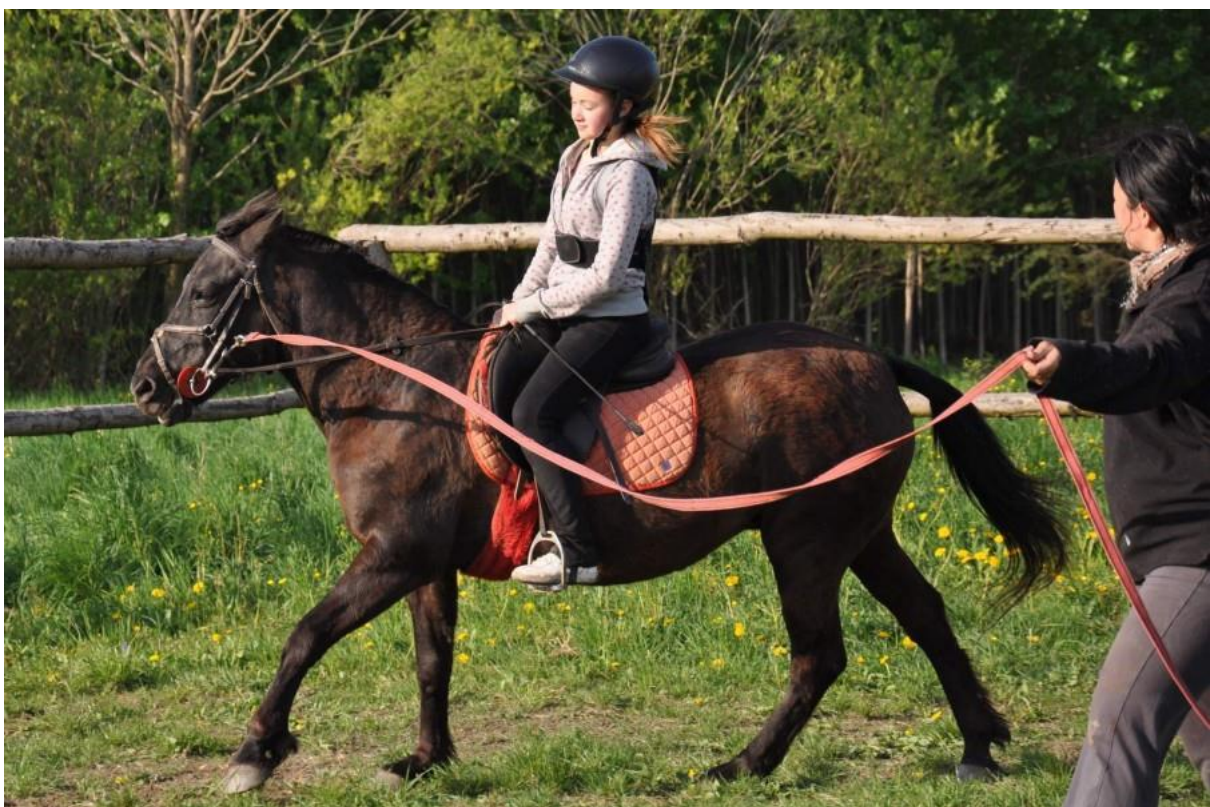
Obr. č. 2 – JK Gracie Dřevohostice z.s.