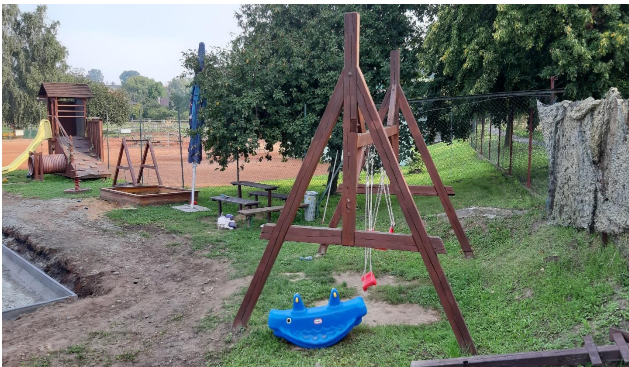
Obr. č. 11 – dětské hřiště za sokolovnou