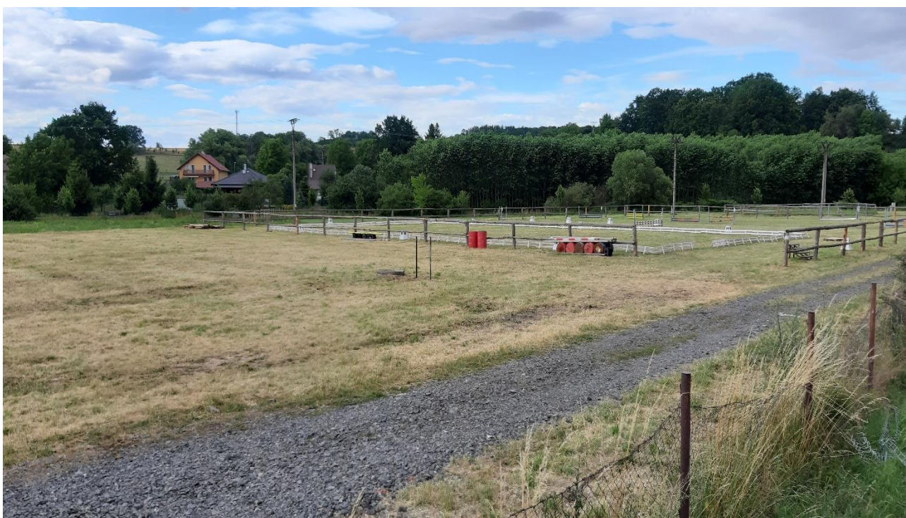
Obr. č. 10 – sportovní areál pro jezdecký sport za sokolovnou