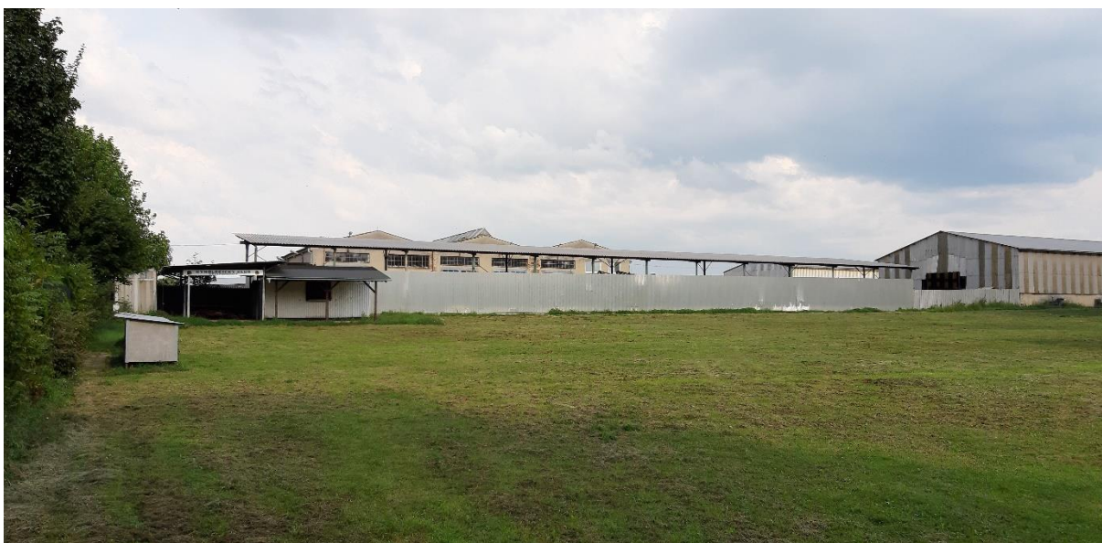
Obr. č. 18 – prostor pro kynologický sport