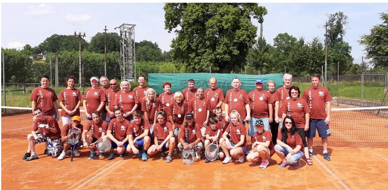
Obr. č. 4 – T.J. Sokol Dřevhostice – Adam cup 2019