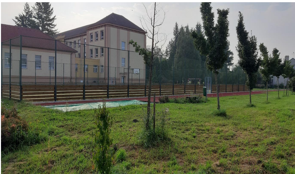
Obr. č. 14 – Multifunkční hřiště u ZŠ