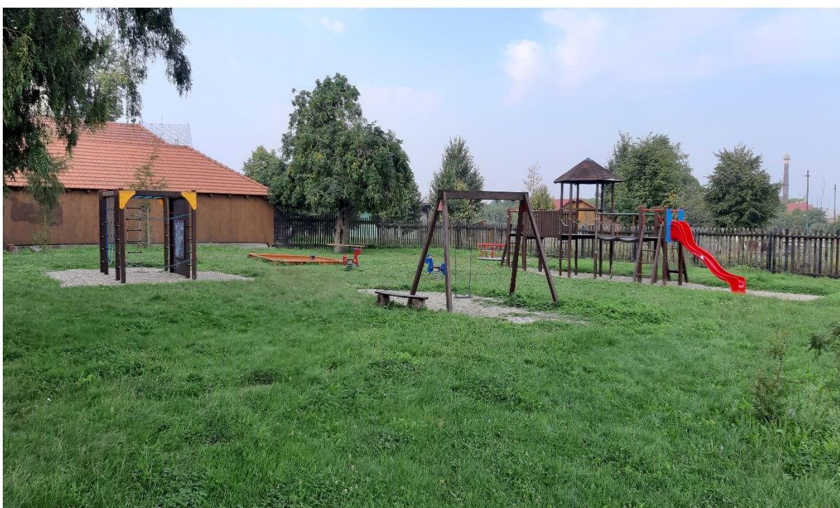
Obr. č. 12 – dětské hřiště v areálu zámku