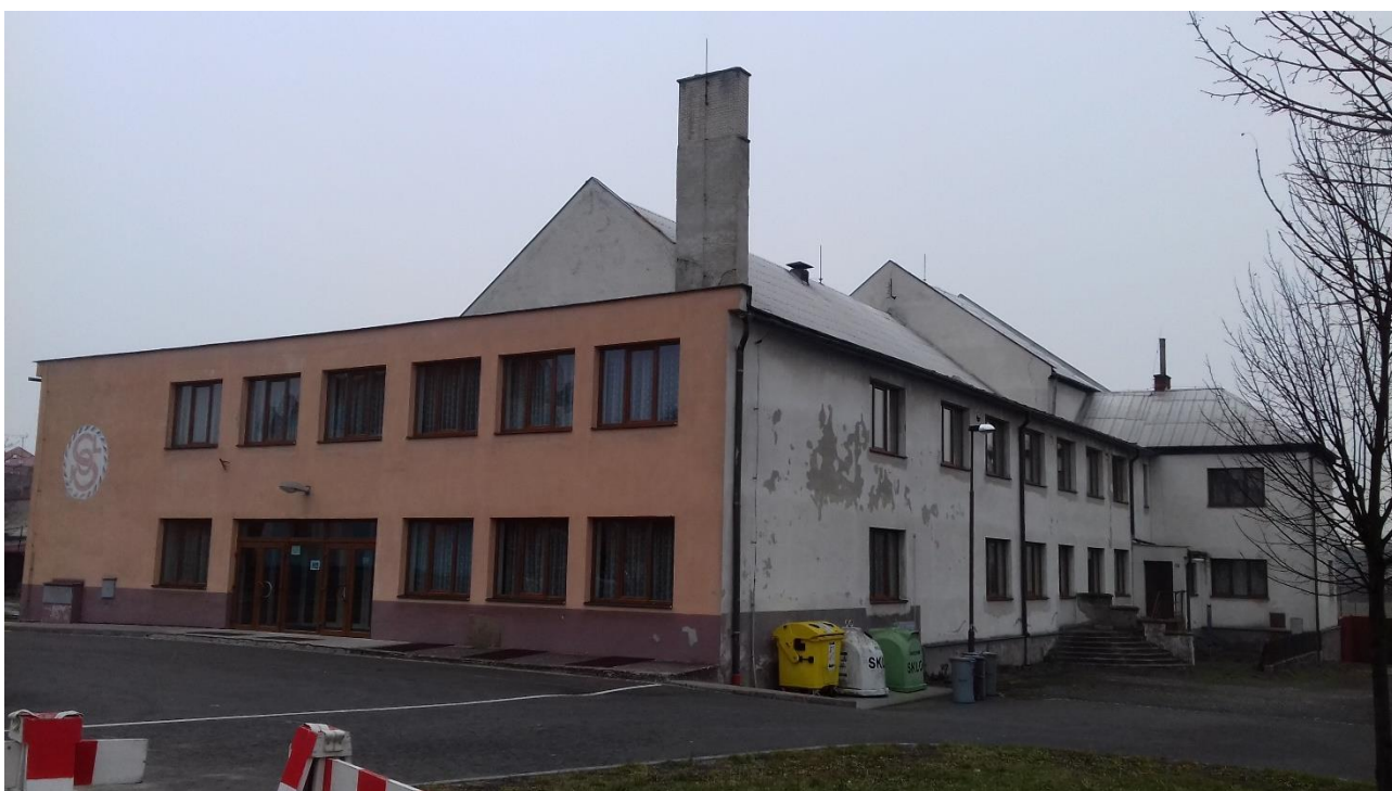
Obr. č. 6 – Sokolovna