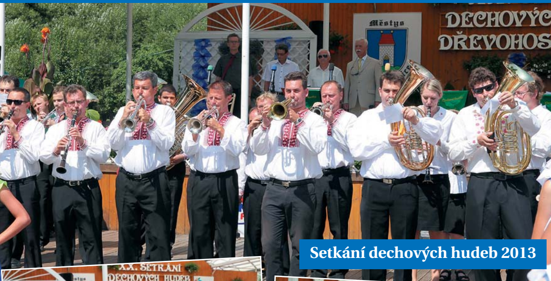
Setkání dechových hudeb 2013